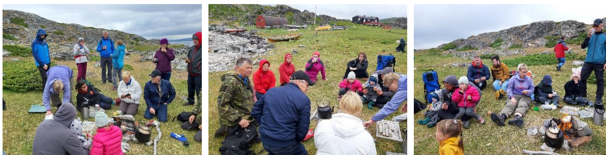
God stemning rundt bålcaffen med historier fra gammel tid

Til tross for sur vind, var stemningen høy på denne suksessfulle kulturminneturen.