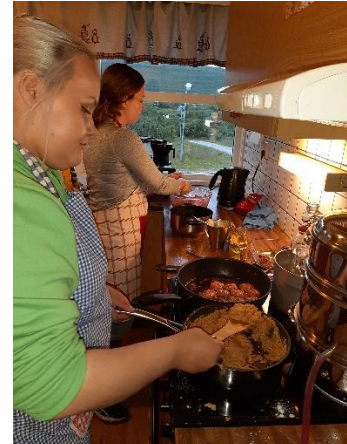
Bilder fra matlaging på kjøkkenet

Prosjektet var en udelt suksess, men meget fornøyde prosjektdeltakere, for ikke å snakke om alt skryt jentene fikk av lokalbefolkningen og besøkende i kaféen.