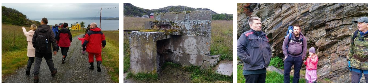
Fra Kulturminneturen 27. august

Denne gangen fikk vi også involvert en lokal grunneier til å være ansvarlig for den sosiale delen av turen, med bålcaffe og historier rundt bålet.