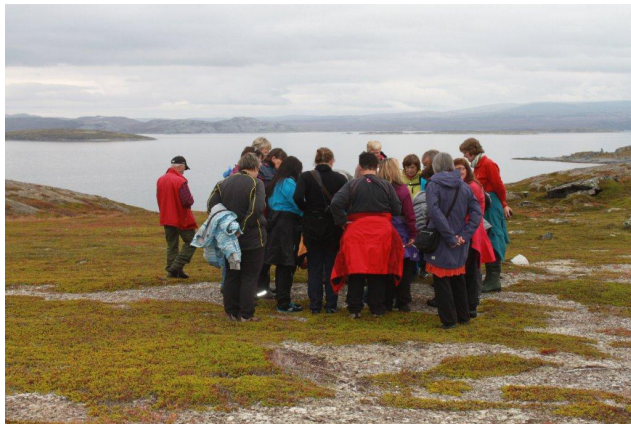
Omvisning, kulturminner på Sandvikshalvøya

I Goarahat og Sandvikshalvøya har det i den siste tiden vært stor aktivitet både hos lokalbefolkningen og på forvaltningsnivå. Det har spesielt vært arbeidet med forvaltningsplanen for området, og lokalbefolkningen er aktivt med. 14. september ble det arrangert Kulturminnedag i området, med utstillinger, guidet tur, servering av lokal tradisjonsmat, informasjon om Goarahat og Sandvikshalvøya som utvalgt område samt foredrag om kulturminnene og tradisjonen i området.