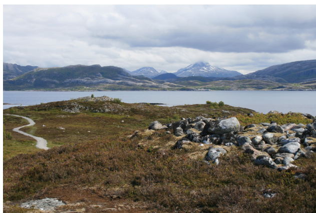
Gravrøyser og lyngheier på Skeisnesset, Leka.