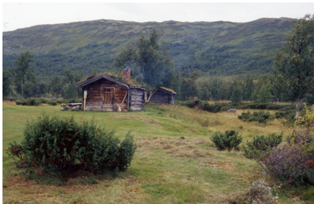
Blåola i Budalen.

SETERDALENE I BUDALEN, SØR-TRØNDELAG: DAGSEMINAR OM KULTURMINNER, BYGNINGSVERN OG TILSKUDDSMULIGHETER 9. OKTOBER