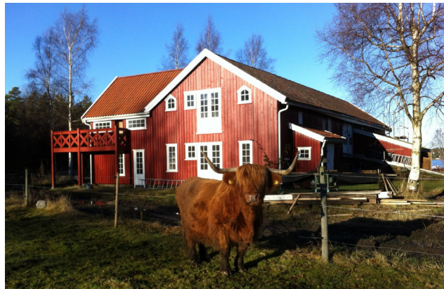
Låve og høylandsku i solskinn.

SKJÆRGÅRDEN ØST FOR NØTTERØY OG TJØME, VESTFOLD: GODE OPPLEVELSER I SKJÆRGÅRDSLÅVEN