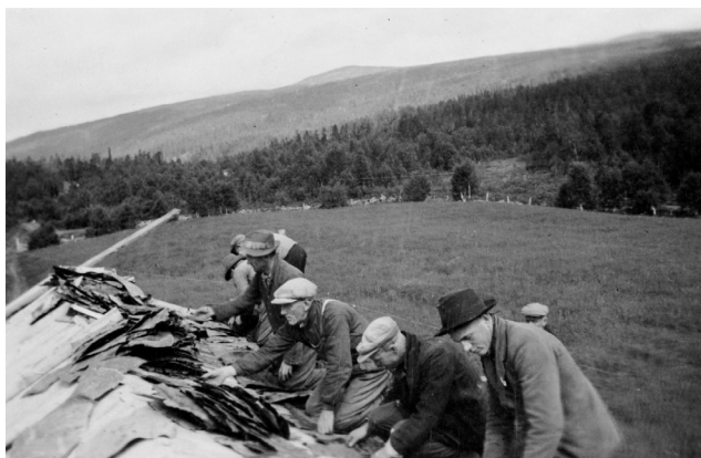
Nevertekking på Tovmo, 1942

Bevaring og bruk av eldre seterbygninger er en viktig del av det utvalgte kulturlandskapet i Budalen. Derfor inviterer Sør-Trøndelag fylkeskommune, i samarbeid med Midtre-Gauldal kommune, Fylkesmannen i Sør-Trøndelag og Norsk Kulturminnefond, til et dagseminar om kulturminner og næring, med spesielt fokus på bygningsvern og tilskuddsmuligheter. Første del av seminaret er rettet mot seterbrukerne i Endal og Budalen, samt administrasjon og politikere i tiliggende kommuner. På slutten av dagen inviteres det til et åpent arrangement for alle som har interesse for bevaring og tradisjonell eller ny bruk av kulturminner.