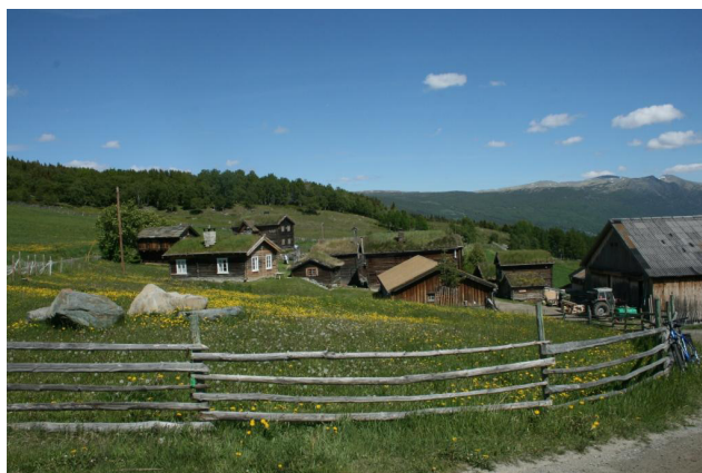
Valbjør gard, Nordherad, Vågå.

Les artiklene her: http://www.utmark.org/