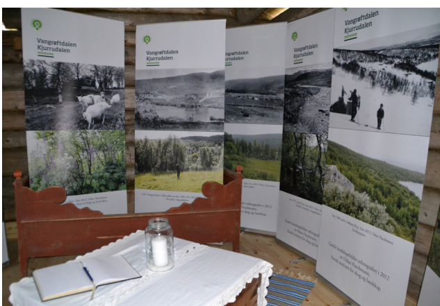
Fotoutstilling med gamle og nye bilder tatt av setereiere og hyttefolk i Os. Bildene ble refotografert av Oskar Puschman i 2012. De minner oss på hva som skjer når det blir mindre beitedyr og landskapet gror igjen, men viser også at det nytter å gjøre noe. Beitearealer blir ryddet og bygninger satt i stand!