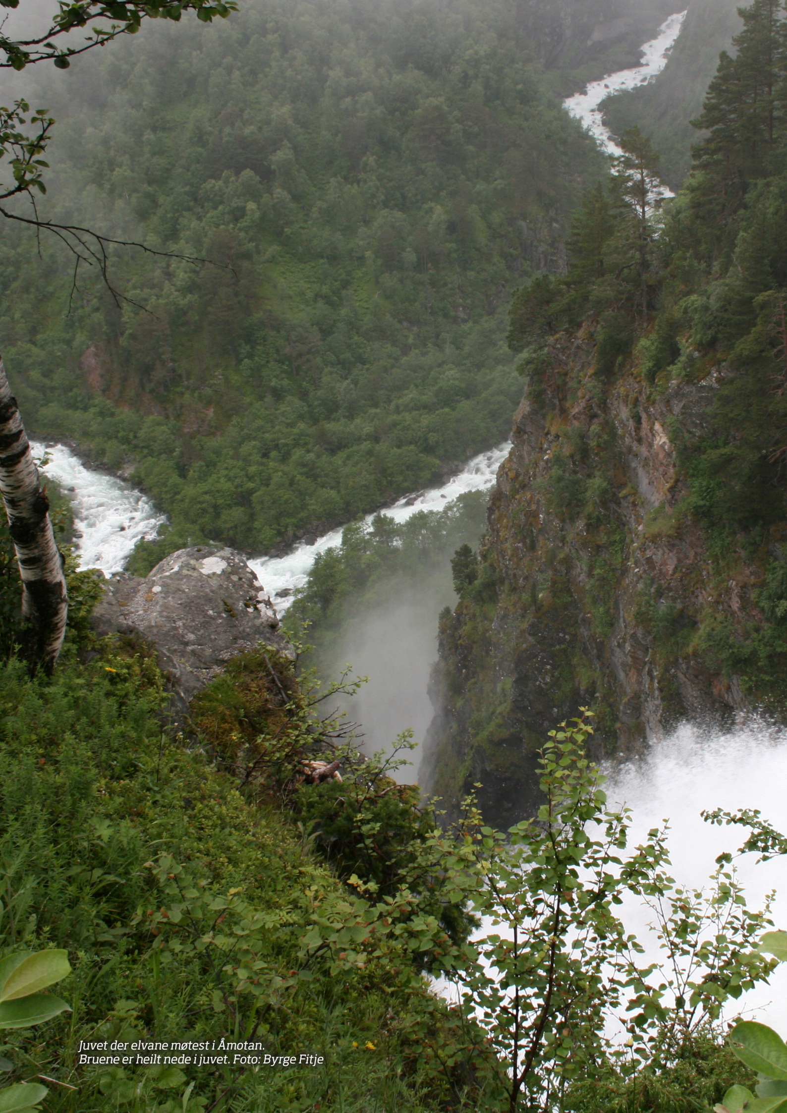
Juven der elvane møtest i Åmotan. Bruene er heilt nede i juvet.