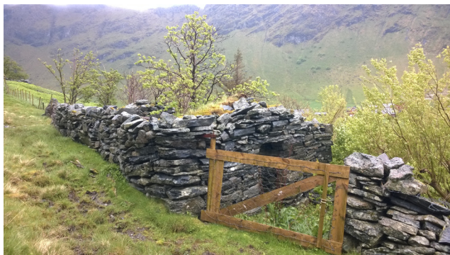
Gardfjøsar der geitene sto under kjeing er bygd inn i gardane på buråsa.

I august arrangerer Hoddevik grunneigarlag kurs i tørrmuring. Kursobjektet er ei buråsa (= fegate eller geil) som vart bygd på 1880-90-talet og er eit visuelt og kulturhistorisk viktig kulturminne. Buråsa vart brukt av alle grunneigarane i bygda, som kombinert ferdselsåre og krøtterveg. I overgangen mellom innmark og utmark finn vi 2 km lange høge, forseggjorte steingardar med opningar til teigar på oppsida og nedsida. I tillegg står det murar av seks tidlegare gardfjøs, det er mura innhegningar som verner vasskjelder mot beitetråkk, og innegjerda frukthagar og innmarks- og utmarksteigar for alle bruka i bygda.