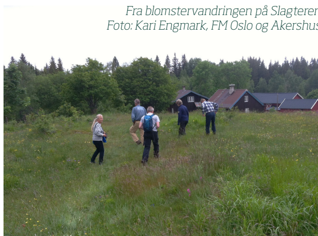
Fra blomstervandringen på Slagteren

23. august vil fylkesmannen arrangere slåttekurs på Finnerud og Svartorseter for dem som har artsrike slåttenger i Oslo og Akershus.