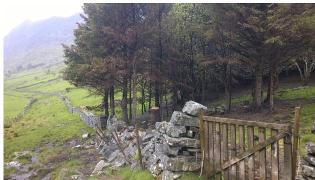
Røtene på dei høge sitkaganene utgjer eit trugsmål for steingardane i buråsa. Hogging av desse er ein del av det prioriterte skjøtselsarbeidet.