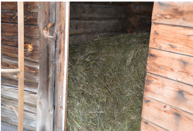
Løe på slåtten ved Nørstenget.