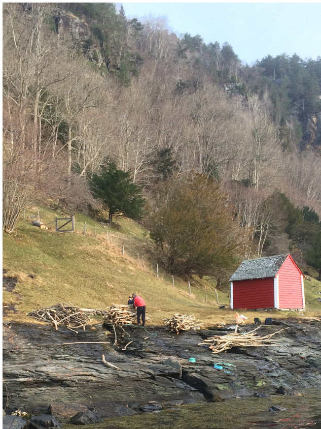
Etter at traseen var rydda vart virket ført ned til svaberga og transportert ut med båt.

Skjøtsel av område med beitedyr krev gode gjerde som held dyra der dei skal vere. I Gjuvslandslia har det vore eit sterkt ønske om å opna opp og auka arealet med artsrik slåttemark. Dei gamle gjerda har forfalle. Vinteren/våren 2014 var turen kome til istandsetting av eit 85 m langt gjerde midt inne i området, frå sjøen og rett opp lia til vel 60 m.o.h. I den bratte, utilgjengelege og veglause lia var det difor naudsynt å samla grunneigarane for å få gjort jobben.