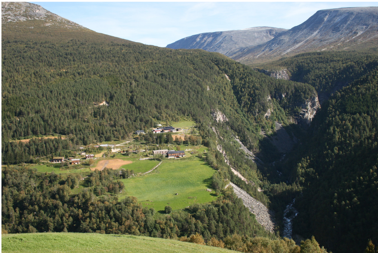
Jenstad. Mange av turistane startar turen her.

Vi håpar arbeida vert gjennomført i sommar slik det er planlagt. Dette vil ha stor betydning for friluftslivet.