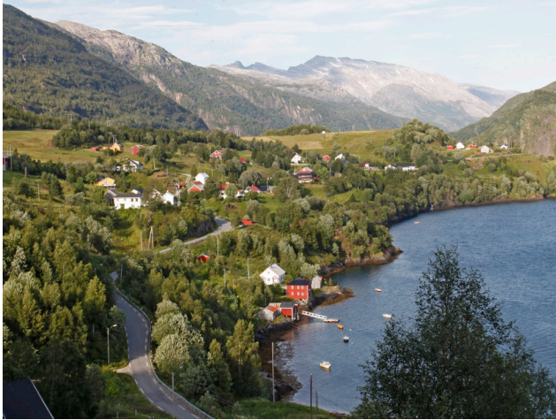
Engan 2013.

NY PLAN FOR FERDSEL OG FORMIDLING STYRKER ARBEIDET MED NÆRINGSUTVIKLING