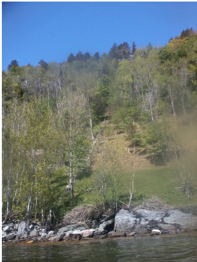
Gjerdet på plass! Her kan ein sjå kor bratt lia er.

Den store jobben med hogging og styving av store askar, oldrar og alm vart gjort på vinteren. Då hogsten var ferdig, hjelpte tyngdekrafta med å få trea ned. Neste steg var å løysa opp stokkerøysa og få stokkane ned til svaberga, for så å fløyta dei heim på sjøen. Ein liten motorisert vinsj hjelpte muskelkraft og tyngdekraft. På dagtid var 3-4 mann i sving, etter arbeidstid kom 3 mann til, samt ein lånt båt. På eit par hektiske ettermiddagar og ein flott vårleg laurdag var alt virket transportert ut. Fleire av grunneigarane