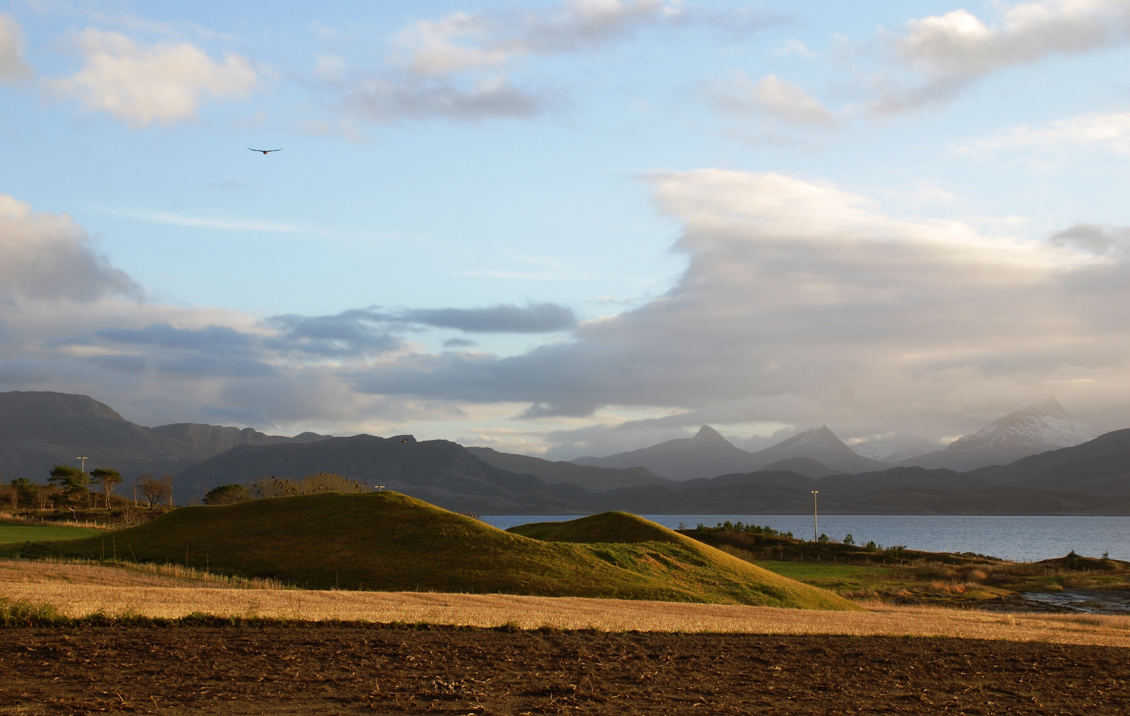
Ørn over Herlaugshaugen, Skei, 2010

ERIK STENVIK jobbet tidligere som seniorrådgiver med ansvar for kulturlandskap og miljøtiltak hos Fylkesmannen i Nord-Trøndelag, blant annet Utvalgte kulturlandskap . Han har også vært distriktsveterinær på Frøya og har lang fartstid som bonde i Namdalseid. Nå er han pensjonist, og kan vie seg til sine mangfoldige interesser - blant annet natur og kultur, historie og tradisjon.