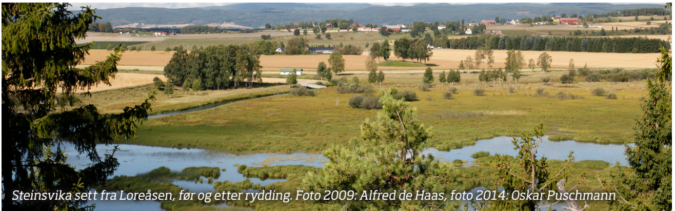
Steinsvika sett fra Loreåsen, før og etter rydding.