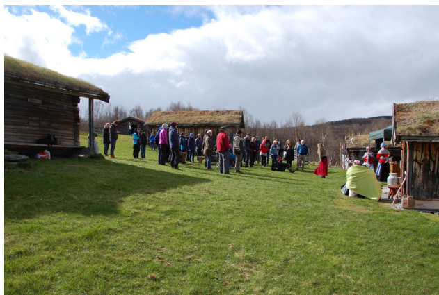
Utistuvollen seter.