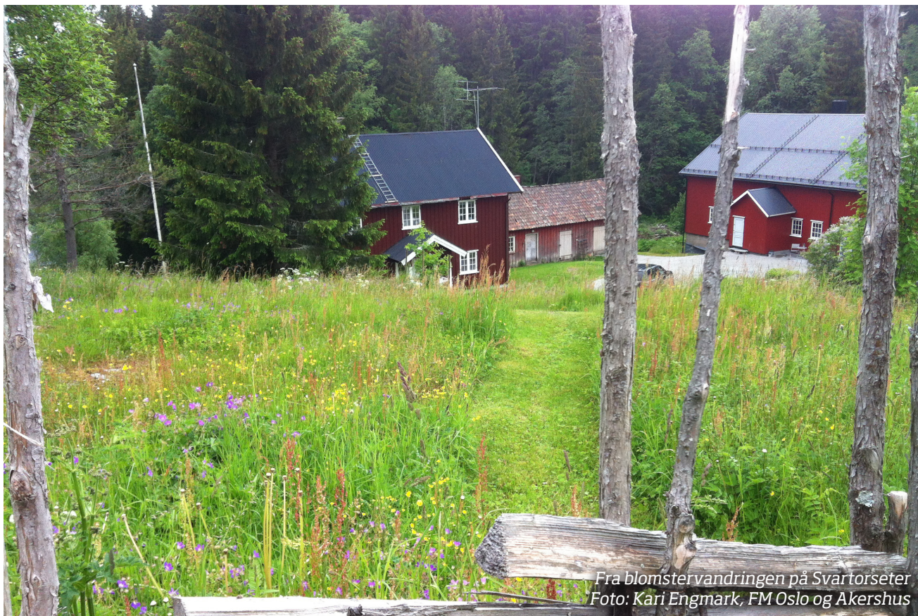
Fra blomstervandringen på Svartorseter

En viktig årsak til at de fire markaplassene Blankvannsbråten, Slagteren, Svartorseter og Finnerud er utvalgt kulturlandskap, er den botaniske artsrikdommen som finnes på plassene, og fordi slåttemarkene blir holdt i hevd. På plassene kan du følge slåttemarkas vekst og utvikling.