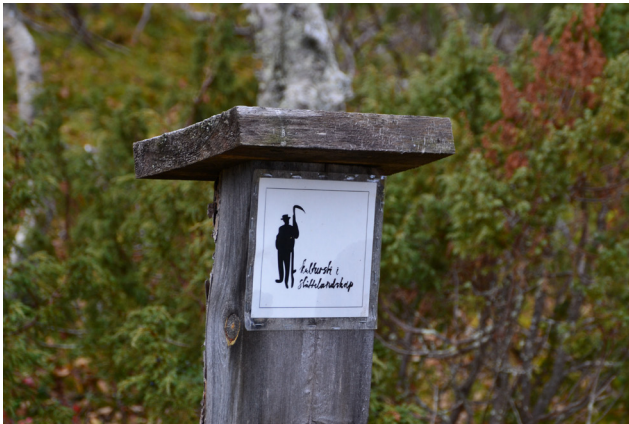
Slåttesti og kultursti i slåttemark.