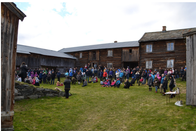
Folksomt, lunt og godt på tunet på Nordvang.