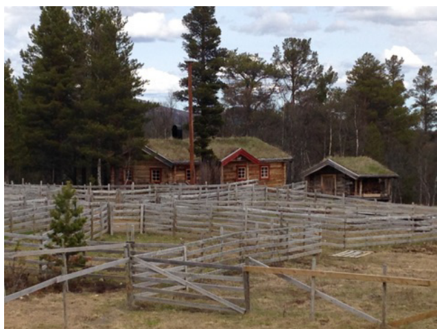
Det er svært stor aktivitet i beitelagene i Seterdalene i Budalen, og samarbeidet om blant annet sankning betyr mye for saueholderne. Her sankebuva til Endal beitelag.