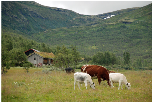
Seterdalene i Budalen 2010.

Endal beitelag vil i sommer ha om lag 3400 sau på beite i Endalen, den ene av de to seterdalene. Dette er nærmest en dobling av sauetallet på få år. Også i den andre dalen, Synnerdalen, er tallet økende. Tilskudd gjennom Utvalgte kulturlandskaper er trolig en medvirkende årsak til den positive utviklingen. Statusen er viktig både for drift, skjøtsel, formidling og tilrettelegging for allmennheten i området.