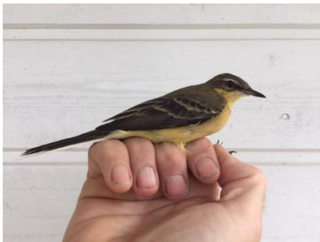
Gulerle – Første for UKL-området

Totalt har det blitt ringmerket 1487 fugler i UKL-området siden 2015, og vi venter med spenning på gjenfangster fra inn- og utland.