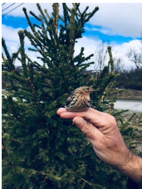
Lappiplerke – Første for UKL-området

På den annen side, så hadde et par arter en god hekkesuksess som Løvsanger og Blåstrupe med gode antall ringmerket i løpet av juli og august.