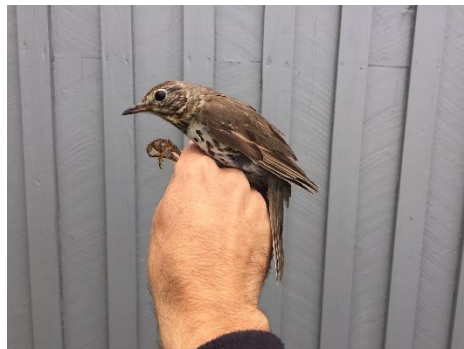
Måltrost – Første for UKL-området