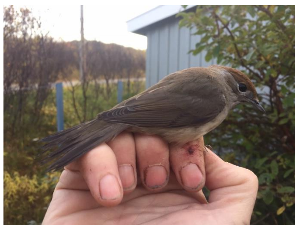
Munk – En uvanlig fugl for Finnmark, men ringmerket både i 2018 og i 2019 ved Maggavann