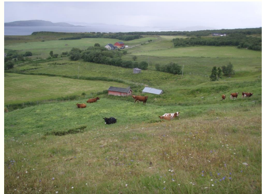
Kyr på beite i Anopset