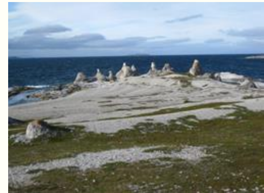
Utsikt over trollene i Trollholmsund