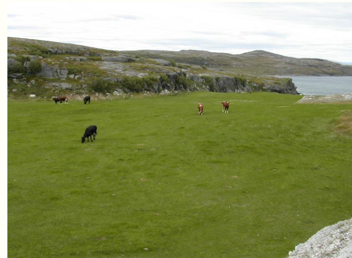
Kyr på beite i Trollholmsund