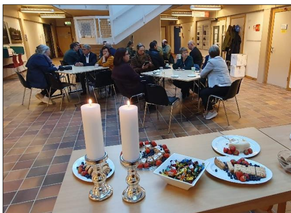
Sosial samling i Rådhus-foajéen etter seremonien.

Vi vil også, allerede nå, ønske alle hjertelig velkomne til neste års markering!