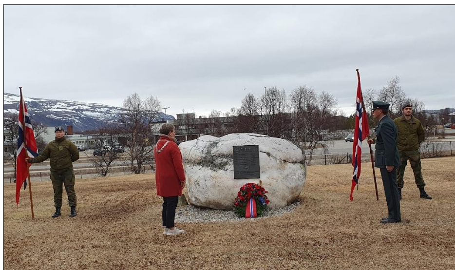
Kransenedleggelse ved minnesteinen

Har du tips til hvordan kommunen kan bli bedre på dette området? Send en e-post til postmottak@porsanger.kommune.no og merk emnet med «Kommunalt veteranarbeid».