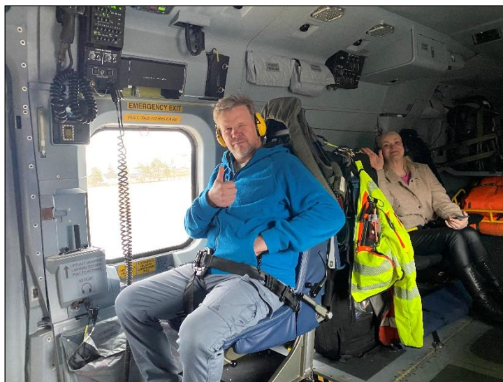
Høyflygende lagbygging stod på tapetet på samlingen