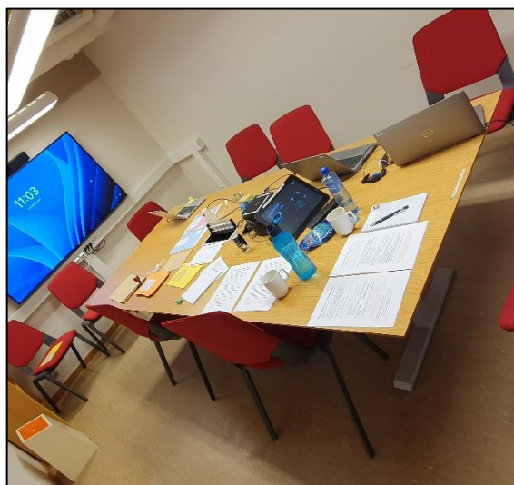
Fra gjennomføringen av prøvevalget i Porsanger kommune

Detaljer om tidlig- og forhåndsstemmer vil snart publiseres, både på kommunens nettsider, og i avisa.