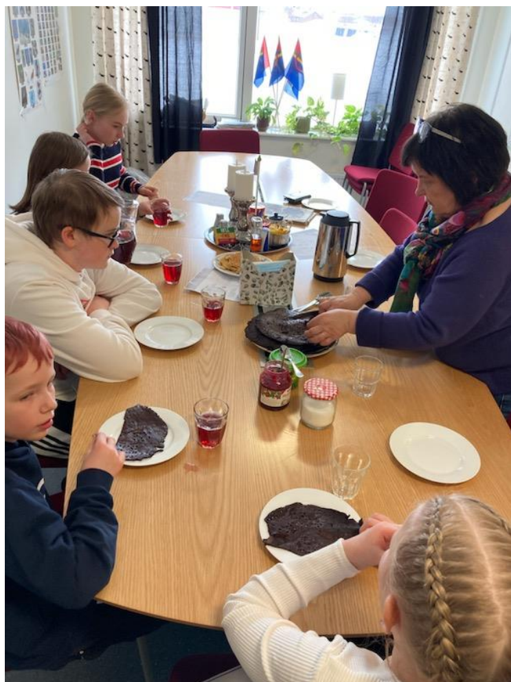
Her smaker elevene på blodpannekaker

Senteret melder om vellykket besøk av elever fra andre kommuner som er på hospitering og har sendt inn hyggelige bilder til internavisa!