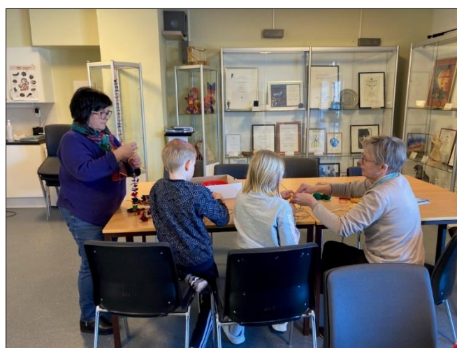
Duodji på Samisk språksenter.