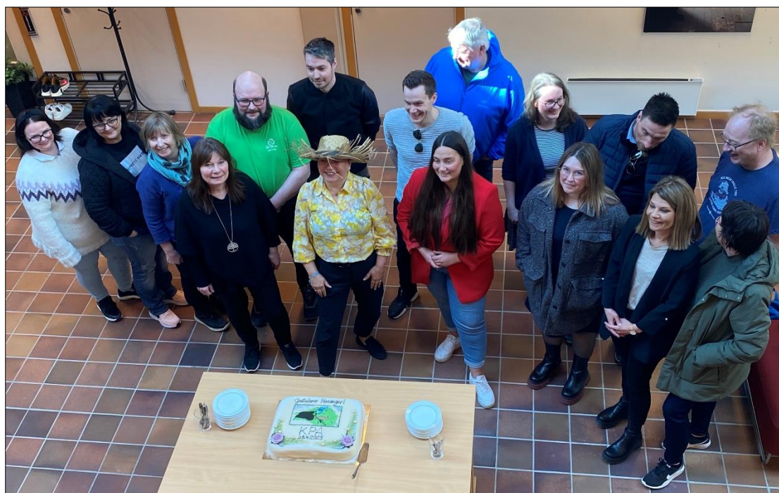
Fornøyde kommunestyrepolitikere feiret etterlengtet vedtak.