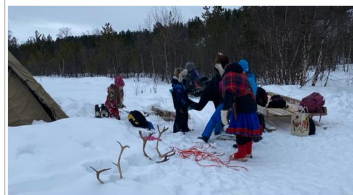
Hospiteringselever og elever fra Lakselv barneskole er i Karasjok og kjører med rein.