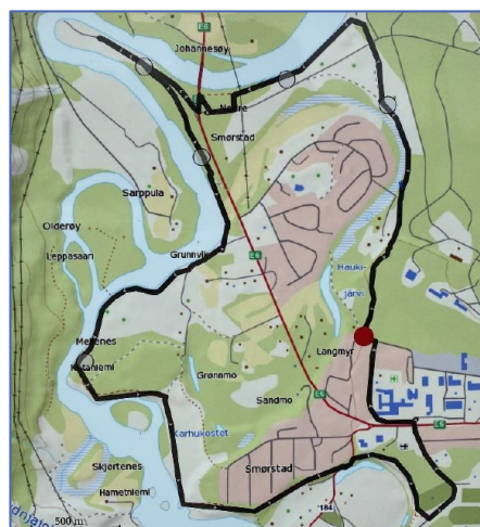
Kart Folkestien: Kilde skilt på området.

Langs flyplassgjerdet går og en sti som og benyttes av befolkningen og forsvaret. En omlegging av trase vil være på drøyt 400 meter av en løype på 8-9 km.